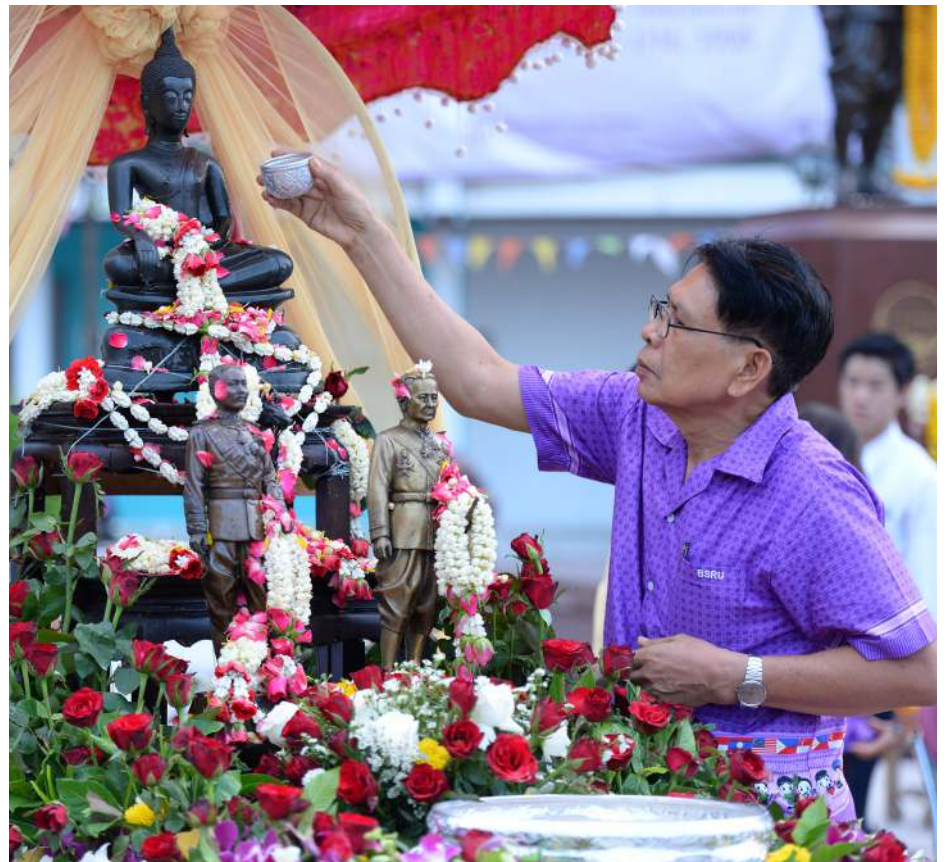
มหาวิทยาลัยราชภัฏบ้านสมเด็จเจ้าพระยา ขอเชิญชวนพี่น้อง “บ้านสมเด็จ” ช่วยกันอนุรักษ์ ส่งเสริม และสืบสานประเพณีสงกรานต์ให้เป็นประเพณีไทยที่งดงาม ให้ดำรงคงอยู่คู่คนไทยและสังคมไทยตลอดไป