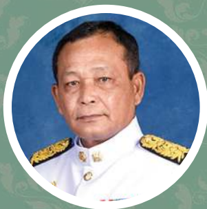
พลเอกดาวพงษ์ รัตนสุวรรณ รัฐมนตรีว่าการกระทรวงศึกษาธิการ