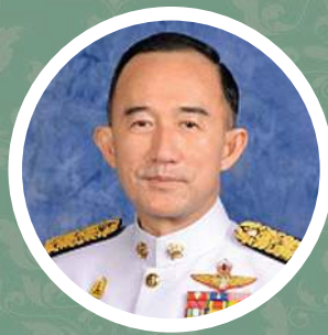
หม่อมหลวงปนัดดา ดิศกุล รัฐมนตรีประจำสำนักนายกรัฐมนตรี