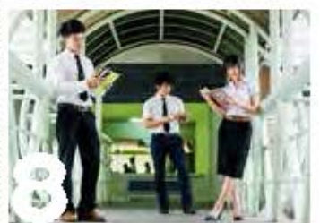
8 Sky Walk ทางเชื่อมระหว่างอาคาร

สถานที่สุดท้ายนี้ถือว่าเป็นแลนด์มาร์คของแต่ละบุคคล สาขาวิชาจะมีการสร้างป้ายชื่อสวยๆไว้บริเวณด้านหน้าของสาขา เช่น สาขาวิชานิติศาสตร์ สาขาวิชาดนตรีตะวันตก บันไดสามารถไปถ่ายรูปเก็บไว้เป็นที่ระลึกในวันซ้อมใหญ่