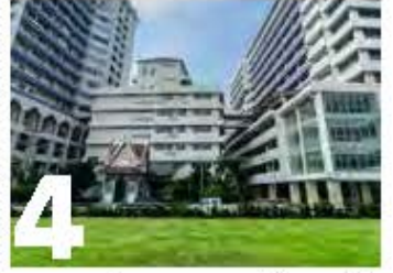
4 สนามฟุตบอล มหาวิทยาลัยราชภัฏบ้านสมเด็จเจ้าพระยา

บ้านเอกะภาคบ้านเรือนไทยทรงปั้นหยาสมัยโบราณ หลังบริเวณอาคาร 27 (อาคารคณะมนุษยศาสตร์ฯ) ปัจจุบันยังเป็นศูนย์กรุงธนบุรีศึกษา เปิดให้เข้าชมได้วันจันทร์ พุธ และศุกร์ อีกด้วย