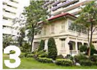
3 บ้านเอกะภาค มหาวิทยาลัยราชภัฏบ้านสมเด็จเจ้าพระยา

ศาลสมเด็จพระเจ้าพระยาบรมมหาศรีสุริยวงศ์ (ช่วง บุนนาค) ที่เรียกติดปากว่า ศาลสมเด็จพระเจ้าพ่อ เป็นศาลที่ประดิษฐานพระรูปปั้นครึ่งองค์ของสมเด็จพระเจ้าพระยาบรมมหาศรีสุริยวงศ์ (ช่วง บุนนาค) ภายในอาคารจัดรูปทรงอยู่บริเวณสนามฟุตบอลหน้าอาคารวิเศษศุภวดี ทัศนทัศน์ทางทิศตะวันออก ความศักดิ์สิทธิ์เป็นที่ประจักษ์กันดีในบรรดาลูกศิษย์ รวมถึงบุคคลทั่วไปที่มีความเคารพศรัทธาในเจ้าพ่อ