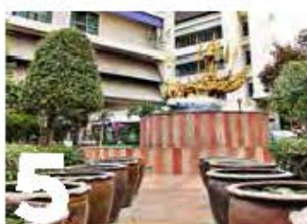
5 สวนหย่อมลานเทพบุตรจักรก

สนามฟุตบอลหญ้าเขียวขจีบริเวณเขตมัธยมสาธิต ติดกับสี่จุดक्रम่วงได้เป็นอย่างดี และยังสามารชมมองเห็นอาคารคณะมนุษยศาสตร์และสังคมศาสตร์และคณะครุศาสตร์อยู่ทางด้านหลัง บันไดสองคอนกรีตสีน้ำมพลาดสำหรับเก็บภาพ