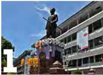
1 ลานสมเด็จพระเจ้าพระยาบรมมหาศรีสุริยวงศ์ หรือ ลานเจ้าพ่อ

ณวันพระราชพิธีัญญาบัตร วันแห่งความภาคภูมิใจอีกหนึ่งวันที่บัณฑิตหลายคนมักนิยมถ่ายภาพเก็บไว้เป็นความทรงจำกับผองเพื่อน ครูอาจารย์และครอบครัว ซึ่งปัจจุบันเป็นที่นิยมสำหรับการจ้างช่างภาพมาเพื่อเก็บภาพทาง BSRU Bulletin จึงขอนำสถานที่ Landmark 8 แห่ง มุมสวยและมีมีความสำคัญในมหาวิทยาลัย มาแนะนำเป็นแนวทางให้บัณฑิตได้แวะไปแวะถ่ายภาพเก็บไว้เป็นที่ระลึก