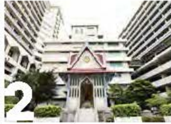
2 ศาลสมเด็จพระเจ้าพระยาบรมมหาศรีสุริยวงศ์ (ช่วง บุนนาค)

บริเวณทางเข้าหน้ามหาวิทยาลัยที่นิสิต นักศึกษา หรือบุคคลภายนอกที่สัญจรไปมามักพบเห็นอยู่เสมอคือลานสมเด็จพระเจ้าพระยาบรมมหาศรีสุริยวงศ์ (ช่วง บุนนาค) ผู้ก่อตั้งและมีคุณูปการต่อมหาวิทยาลัยสร้างขึ้นเมื่อวันที่ 19 มกราคม 2519 และสำเร็จเรียบร้อยในปีต่อมาคือวันที่ 19 มกราคม 2520