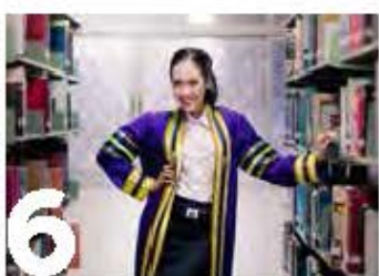
6 สำนักวิทยบริการและเทคโนโลยีสารสนเทศ

อีกหนึ่งสวนหย่อมที่เต็มไปด้วยความร่มรื่นจากสีเขียวขจี และรูปปั้นลอยตัวของเทพบุตรจักรกตงเด่นเป็นสง่าอยู่กลางสวนเทพบุตรจักรกเป็นหนึ่งในองค์ประกอบของตราประจำตำแหน่งของสมเด็จพระเจ้าพระยาบรมมหาศรีสุริยวงศ์ (ช่วง บุนนาค) คือตราสุริยมณฑล ซึ่งสวนนี้อยู่บริเวณระหว่างอาคาร 2 และอาคาร 6