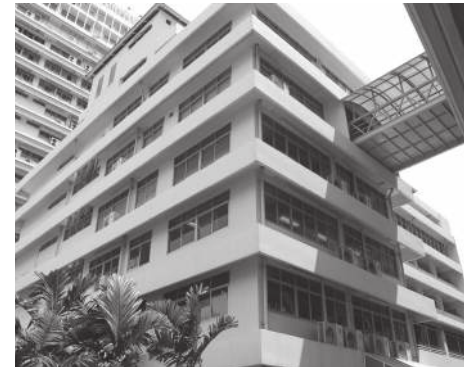
▲ จุดเชื่อมอาคาร 30