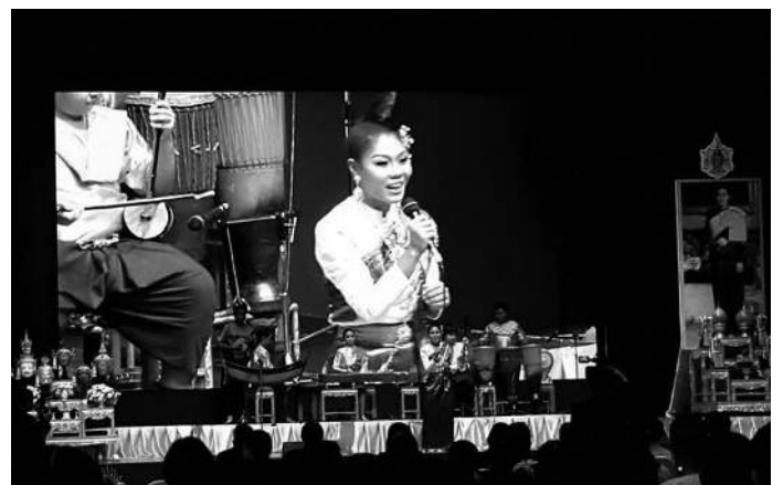
▲ บรรยากาศในการแสดง