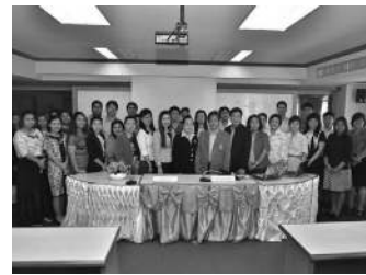
▲ “การจัดการ” จัดบริหารความเสี่ยงฯ ระดับหลักสูตร

คณะวิทยาการจัดการ มหาวิทยาลัยราชภัฏบ้านสมเด็จเจ้าพระยา จัดอบรมเชิงปฏิบัติการ หัวข้อ “การบริหารความเสี่ยงและการเขียนแผนบริหารความเสี่ยง ระดับหลักสูตร” ในวันพฤหัสบดีที่ 26 มีนาคม 2558 ณ ห้องประชุมชั้น 5 คณะวิทยาการจัดการ ด้วยแผนบริหารความเสี่ยงถือเป็นเครื่องมือที่มีความสำคัญที่จะช่วยให้มหาวิทยาลัยสามารถดำเนินการได้สำเร็จตามแผนยุทธศาสตร์ของมหาวิทยาลัย การนำกระบวนการบริหารความเสี่ยงมาใช้ในระดับหลักสูตรจะเป็นหลักประกันในระดับ