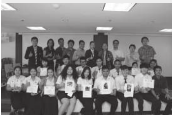
▲ การประกวดผลงาน “1 วัน 1 ภาพความทรงจำ”

หลังจากเสร็จสิ้นโครงการผู้นำเยาวชนน้อมนำพระราชดำริ รุ่นที่ 1 สำนักศิลปะและวัฒนธรรม มหาวิทยาลัยราชภัฏบ้านสมเด็จเจ้าพระยา จัดการประกวดผลงาน “1 วัน 1 ภาพความทรงจำ” โครงการอันเนื่องมาจากพระราชดำริเศรษฐกิจพอเพียง ณ ห้องประชุมชั้น 5 อาคาร 30 มหาวิทยาลัยราชภัฏบ้านสมเด็จเจ้าพระยา โดยให้นิสิต นักศึกษา ที่เข้าร่วมโครงการ ได้ส่งภาพถ่ายเข้าประกวด ผลการประกวดได้แก่