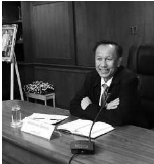
▲ ผู้บริหาร มรภ. นครปฐมให้การต้อนรับทีม บมส.