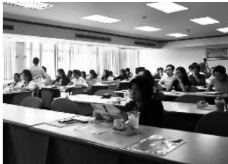
▲ อบรมลดปัญหาด้านการประเมินผลที่เกิดจากการสอน

สำนักส่งเสริมวิชาการและงานทะเบียน มหาวิทยาลัยราชภัฏบ้านสมเด็จเจ้าพระยา จัดประชุมโครงการเสวนาทางวิชาการ เรื่อง การลดปัญหาด้านการประเมินผลที่เกิดจากการสอน เมื่อวันที่ 12 มีนาคม 2558 ณ ห้องประชุมอาคารเฉลิมพระเกียรติอาคาร 7 ชั้น 5 โดยมี รศ.ดร.วิบูลย์ วัฒนาภิรมย์กุล เป็นประธานเปิดงาน สำนักงานส่งเสริมวิชาการและงานทะเบียนเป็นหน่วยงานสนับสนุนด้านวิชาการ จึงจัดโครงการเครือข่ายเพื่อสร้างความรู้ความเข้าใจด้านหลักสูตร