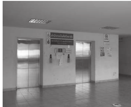
▲ จุดรอลิฟต์ที่ข้างร้านอะเมซอน

บ างช่วงเวลา พื้นทางเดินเท้าภายในมหาวิทยาลัยราชภัฏบ้านสมเด็จเจ้าพระยา อาจจอบ้างคับคั่ง ทำให้นักศึกษาหรือผู้มาติดต่อราชการ ต้องลงไปใช้เส้นทางเดินรถซึ่งก็อาจเสี่ยงต่อความปลอดภัย ด้วยขนาดพื้นที่ใช้สอยแนวราบภายในมหาวิทยาลัยมีจำกัด หลายส่วนถูกใช้ไปเพื่อการจอดรถ จัดวางโต๊ะที่นั่งสำหรับการสนทนา และการจัดสวนไประดับเพื่อความร่มรื่นสวยงาม ทำให้ช่องทางที่จะอำนวยความสะดวกแก่ผู้เดินเท้ามีน้อยลงไป อีกทั้งการประสบปัญหาการสัญจรยังเกิดขึ้นกับการต้องใช้ลิฟต์ เพื่อขึ้นสู่ชั้นเรียน ขณะที่แต่ละอาคารสูงมีจำนวนลิฟต์จำกัด มหาวิทยาลัยได้ตระหนักถึงปัญหาดังกล่าว และได้มีการแก้ปัญหาและอำนวยความสะดวกด้วยการใช้งานออกแบบสถาปัตยกรรมเพื่อลดปัญหาการจราจรบนพื้นราบ ด้วยการออกแบบจัดสร้างทางเดินลอยฟ้า (Skywalk) เชื่อมการสัญจรระหว่างอาคาร สร้างความสะดวกสบายต่อการเดินทางระหว่างการเปลี่ยนห้องเรียน การติดต่อประสานงานติดต่อราชการกับหน่วยงานภายในได้เป็นอย่างดี