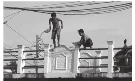
▲ เรื่องราวจากการระดมความคิด