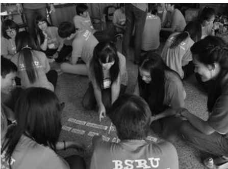
▲ นิสิตกระตุ้นความคิดในกิจกรรม