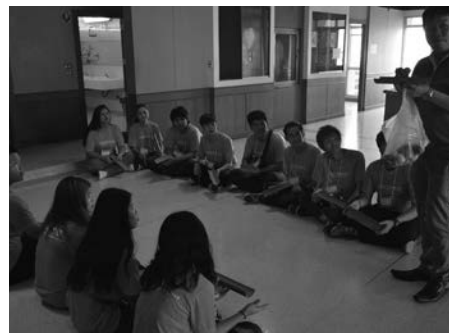
▲ บรรยากาศการเข้ากิจกรรมใน Station ต่างๆ