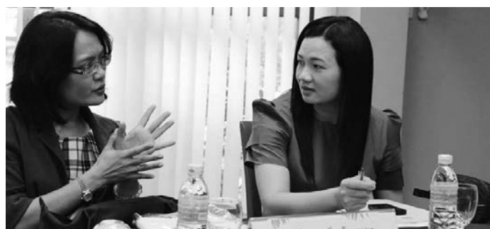
▲ การหารือระหว่างการประชุมเครือข่ายคณบดี