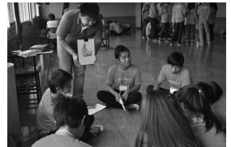
▲ วิทยากรสร้างกิจกรรมเพื่อเข้าใจในภาษาอังกฤษ

ด้วยตระหนักถึงความสำคัญมหาวิทยาลัยราชภัฏบ้านสมเด็จเจ้าพระยา จึงมีนโยบายที่จะพัฒนาศักยภาพและขีดความสามารถในการใช้ภาษาอังกฤษให้กับ