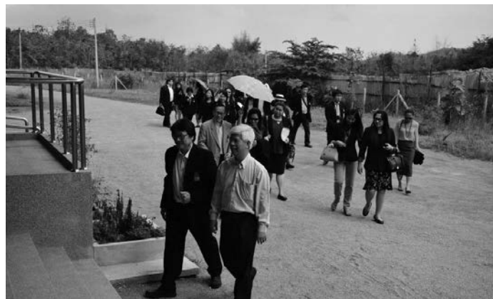
▲ คณะครุศาสตร์ ศึกษาดูงาน ณ มหาวิทยาลัยเทคโนโลยีพระจอมเกล้าธนบุรี