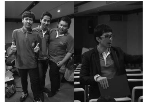
▲ วิทยากรและTA ในโครงการ