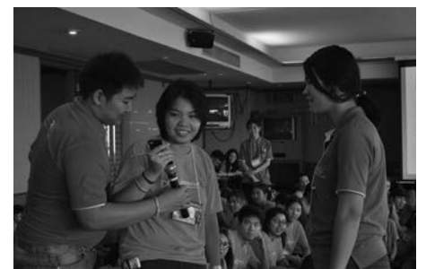
▲ บรรยากาศการทำกิจกรรม การมีส่วนร่วมในร่วมกิจกรรมของนิสิต