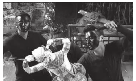
▲ มุมมองที่เกิดขึ้นจากการถ่ายทำ