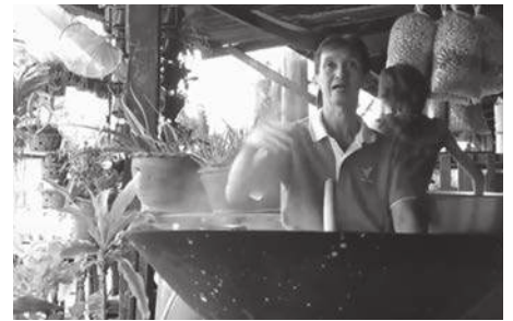
▲ บางส่วนของสารคดีเทคโนโลยี