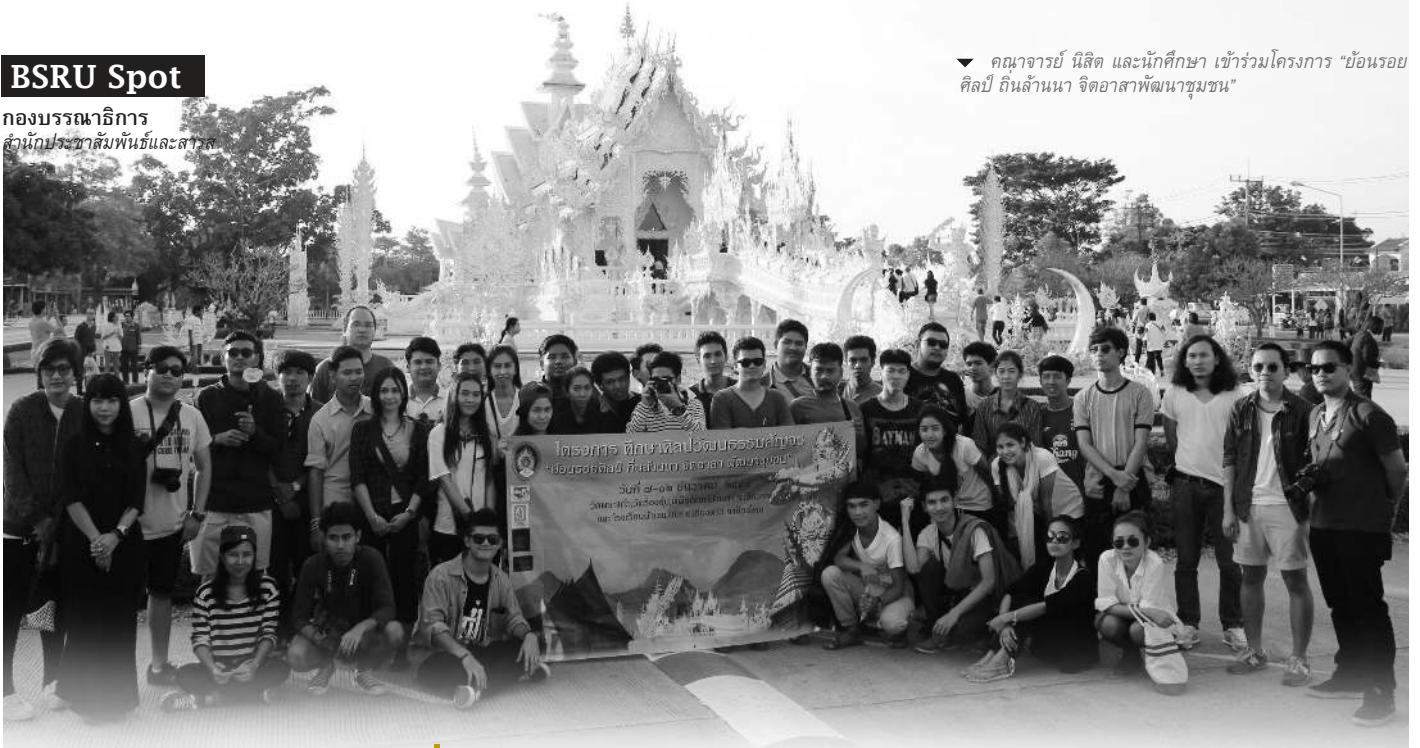
▼ คณาจารย์ นิสิต และนักศึกษา เข้าร่วมโครงการ "ย้อนรอย ศิลป์ ถิ่นล้านนา จิตอาสาพัฒนาชุมชน"