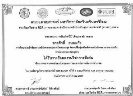
▲ ประกาศนียบัตรรับรองงานประชุมวิชาการประจำปี R2R Forum ครั้งที่ 4 ของเครือข่าย R2R ภาคกลางตอนบน