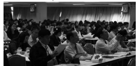
▲ ผู้เข้าร่วมอบรมโครงการ "การสร้าง ความเข้าใจตัวบ่งชี้ระดับ หลักสูตร คณะ สถาบัน ตามเกณฑ์ประกันคุณภาพการศึกษา ภายใน ระดับอุดมศึกษา ปีการศึกษา 2557