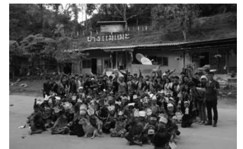
▼ นักเรียนโรงเรียนบ้านแม่แมะ อ.เชียงดาว จ.เชียงใหม่ เข้าร่วมโครงการ “พิธีสอนน้อง วาด ร้อง เล่น เต้นรำ”