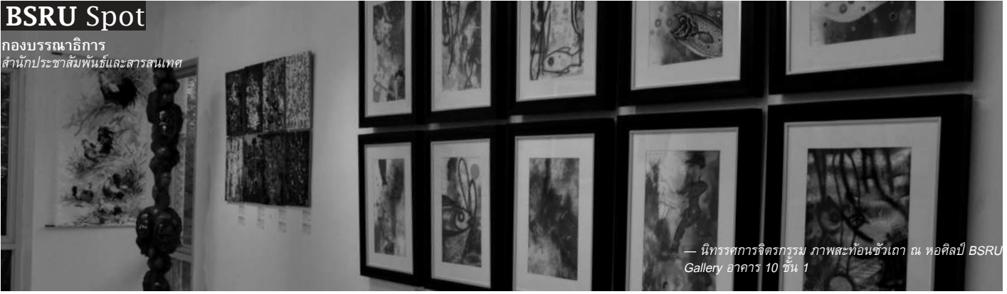
— นิทรรศการจิตรกรรม ภาพสะท้อนชั่วเถา ณ หอศิลป์ BSRU Gallery อาคาร 10 ชั้น 1