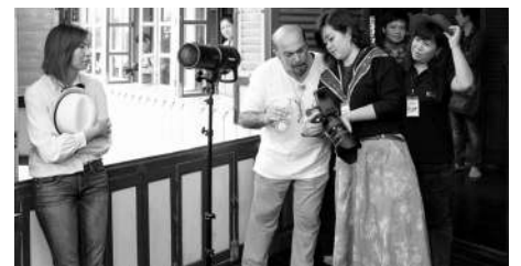
-- ภาพบรรยายภาคภายในการอบรม BSRU Image Photography Workshop