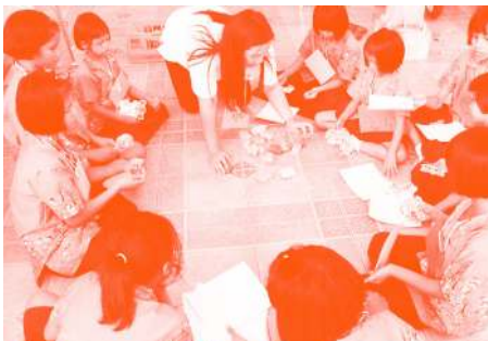
— นักเรียนจากสถานสงเคราะห์บ้านราชวิถีร่วมในกิจกรรมการพัฒนาทักษะการคิด

ความความปลอดภัยในการดำรงชีวิต ดังนั้น ถ้าเด็กกลุ่มนี้ได้รับการพัฒนาด้านการคิด ซึ่งจะเป็นพื้นฐานหนึ่งในการดำรงชีวิตต่อไป ถ้าเขามีลักษณะการคิดที่ดี สามารถคิดอย่างเป็นระบบแล้วการมองอนาคตหรือการวางแผนชีวิตของเขา ก็จะดีขึ้นด้วย อย่างเช่นกิจกรรมการคิดสร้างสรรค์ที่นำไปรวมสอน คือให้เด็กฟังนิทานและให้เขาวาดรูปหรือปั้นออกมาตามจินตนาการที่เขาคิดไว้ เด็กจะได้รู้จักการคิดถ่ายทอดสิ่งที่คิดออกมาเป็นรูปธรรมมากขึ้น สถานสงเคราะห์เด็กหญิงบ้านราชวิถีหรือเรียกสั้น ๆ ว่าบ้านราชวิถี เป็นหน่วยงานสังกัดสำนักคุ้มครองสวัสดิภาพหญิงและเด็ก กรมพัฒนาสังคมและสวัสดิการ กระทรวงพัฒนาสังคมและความมั่นคงของมนุษย์ ให้การสงเคราะห์และพัฒนาเด็กหญิง ตั้งแต่อายุ 5-18 ปี ประกอบไปด้วยเด็กที่ประสบปัญหาทางสังคมด้านต่างๆ ไม่ว่าจะเป็น ขาดผู้อุปการะ ครอบครัวยากจน หรือแตกแยก ได้รับการเลี้ยงดูไม่เหมาะสม หรือบิดามารดาถูกต้องโทษ ปัจจุบันมีเด็กอาศัยอยู่ประมาณ 400 คน ซึ่งการไปจัดกิจกรรมครั้งนี้ของคณะครุศาสตร์ได้รับการตอบรับที่ดีจากบ้านราชวิถี เขาต้องการให้เรากลับไปจัดกิจกรรมอีกครั้ง เพราะเด็กได้รับการฝึกคิดอย่างเป็นระบบจริงๆ และแตกต่างจากบทเรียนที่เค้าได้เรียน