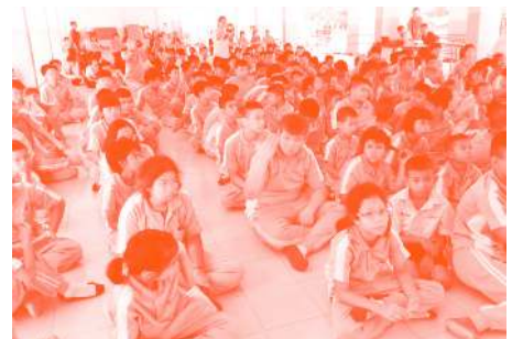
— ครูตัวแทนจากคณะครุศาสตร์กำลังร่วมทำกิจกรรมกับนักเรียนโรงเรียนโสตศึกษา จังหวัดนนทบุรี