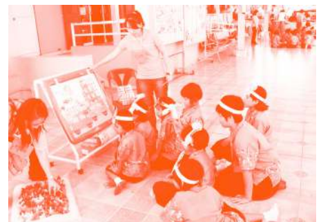
— ครูตัวแทนจากคณะครุศาสตร์กำลังร่วมทำกิจกรรม การใช้ศิลปะทัศนศิลป์เพื่อการบำบัด กับนักเรียนโรงเรียนโสตศึกษา จังหวัดนนทบุรี

ในกิจกรรมครั้งนี้ เป็นการนำศาสตร์ทั้งสามด้านมาบูรณาการร่วมกันจัดกิจกรรมบำบัดแก่ผู้ที่มีความบกพร่องทางการได้ยิน จำนวน 111 คน และโครงการดังกล่าว ได้มีการจัดมาอย่างต่อเนื่องถึง 7 ปี ด้วยกัน คือโครงการศิลปะบำบัด ครั้งที่ 7 ได้ผลตอบรับดีมาก ทำให้ทางคณะได้สนับสนุนโครงการดนตรีบำบัด และนาฏยบำบัดในปีถัดมา ซึ่งเป็นโครงการที่ทำประโยชน์แก่ชุมชนและสังคม ทำให้ได้รับรางวัลโครงการเปี่ยมประสิทธิภาพจากทางมหาวิทยาลัยในปี พ.ศ.2557 และคาดว่าจะจัดกิจกรรมในรูปแบบนี้อีกอย่างต่อเนื่อง เพื่อให้เกิดประโยชน์แก่สังคมต่อไป •